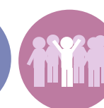
Place dans la société